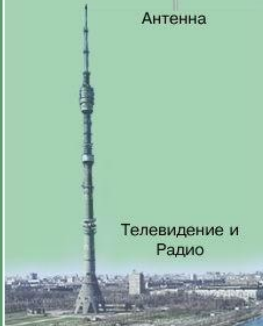
Телевидение и Радио

Подготовка сообщения о чрезвычайной ситуации