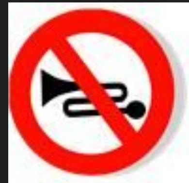
Подача звукового сигнала запрещена