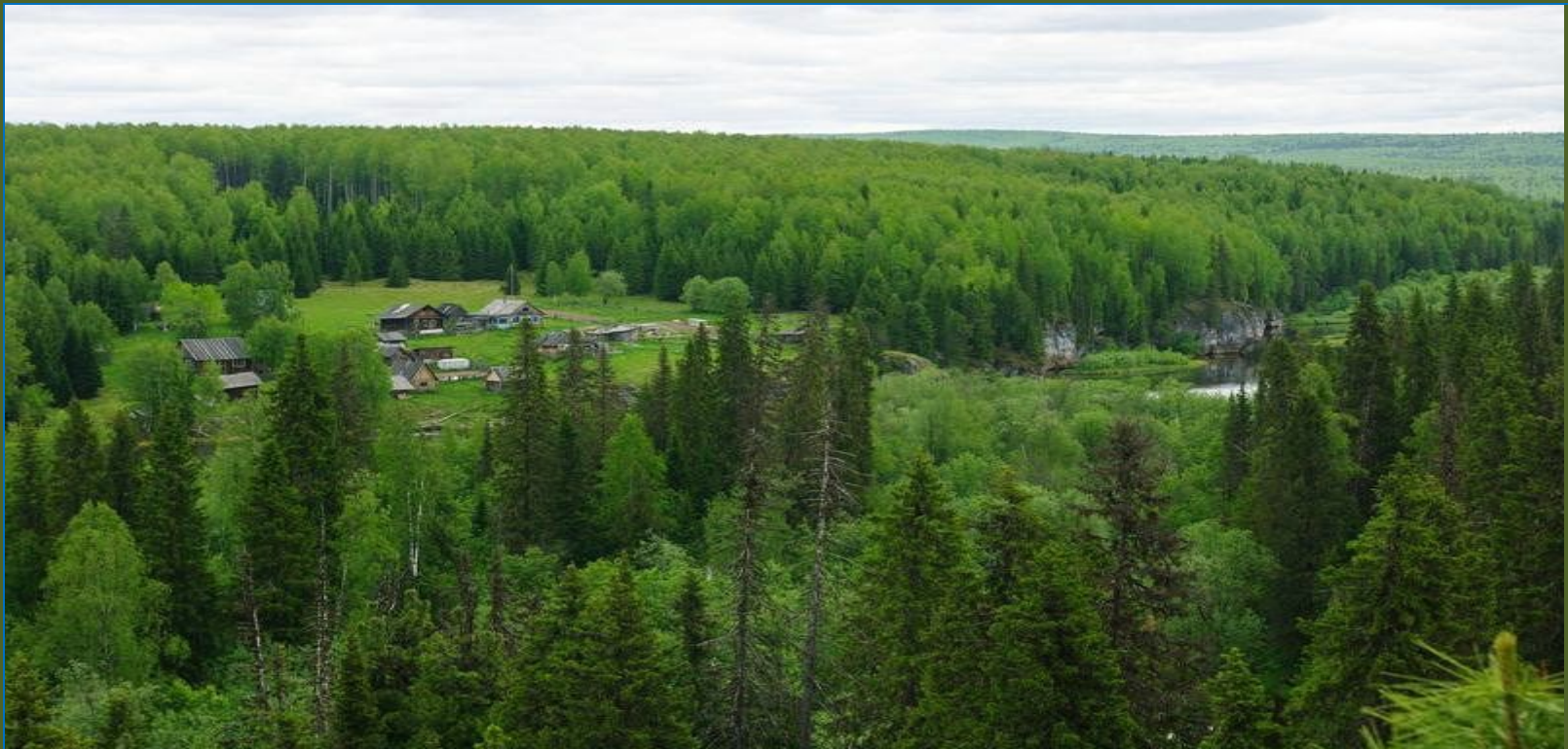
Кордон Шежым на территории Печоро- Илычского заповедника

Один из самых старых природных парков России, он был создан 1930 году. Находится на западных склонах Северного Урала и занимает площадь 721,3 тыс. га. Носит статус биосферного резервата.