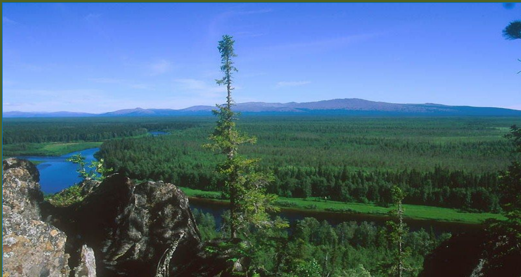
В верховьях реки Уньи

Девственные леса занимают 15 % территории Республики Коми и относятся к экорегиону уральской тайги. Они состоят из двух крупных охраняемых природных территорий: Печоро-Илычского заповедника и национального парка «Югыд Ва».