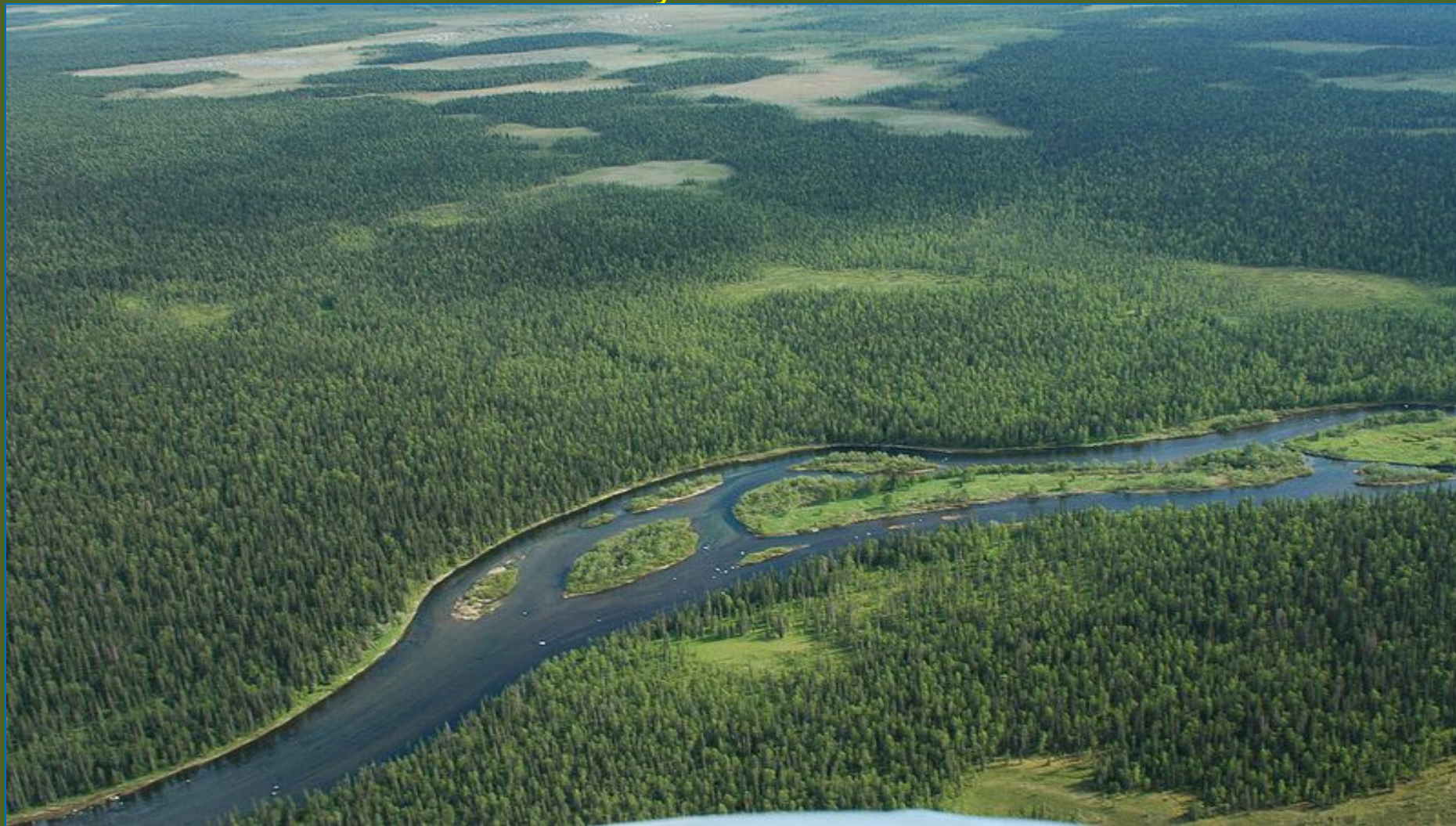
Среднее течение реки Ипыч

Девственные леса Коми – это самый большой нетронутый природный массив в Европе, расположившийся на северо-востоке Республики Коми.