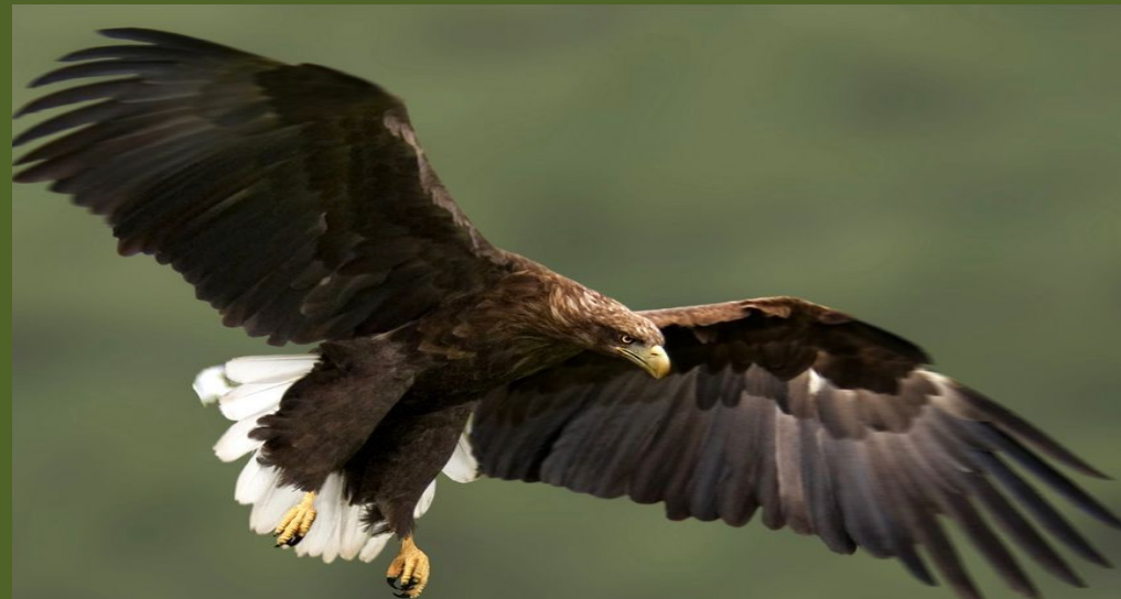
Орлан - белохвост