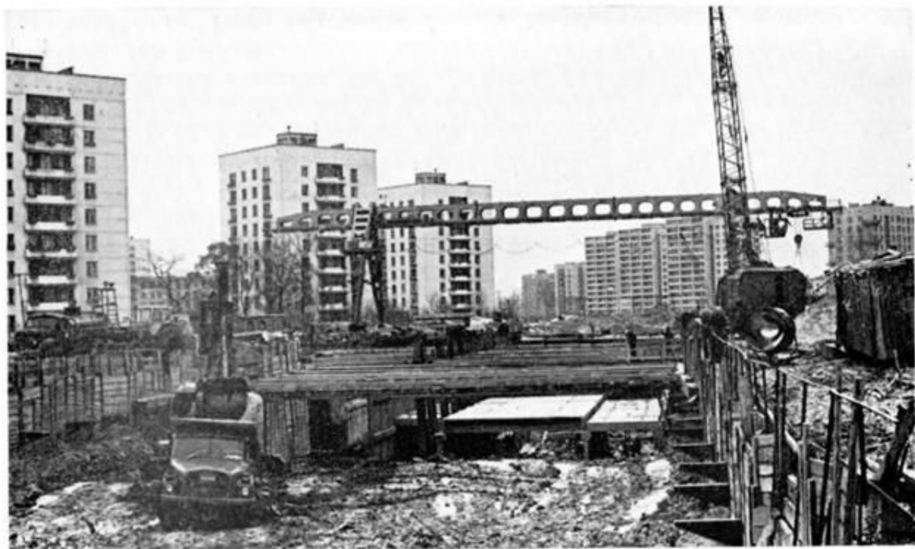
ВЫСТРОИТЕЛЬСТВО НА ПИЛОНАХ