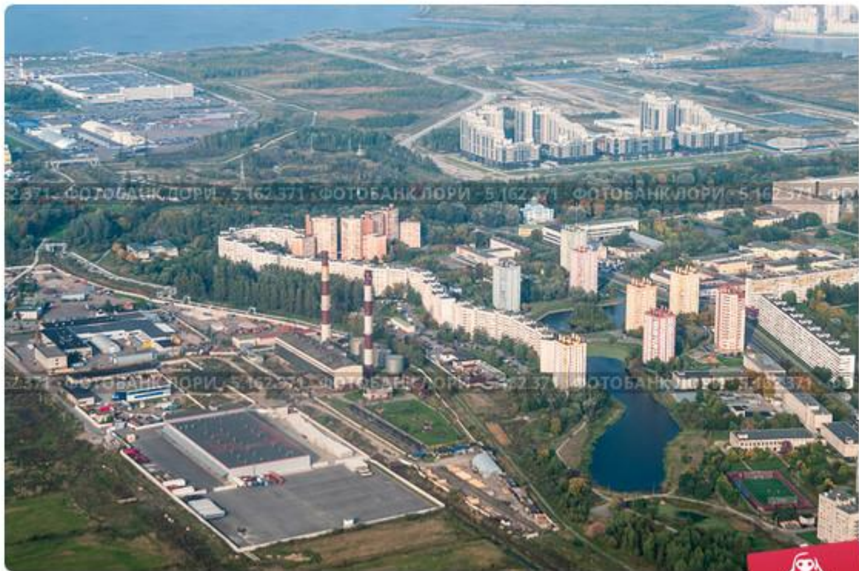
Улица Пионерстроля, 4-я Красносельская котельная ГУП "ТЭК", Санкт-Петербург