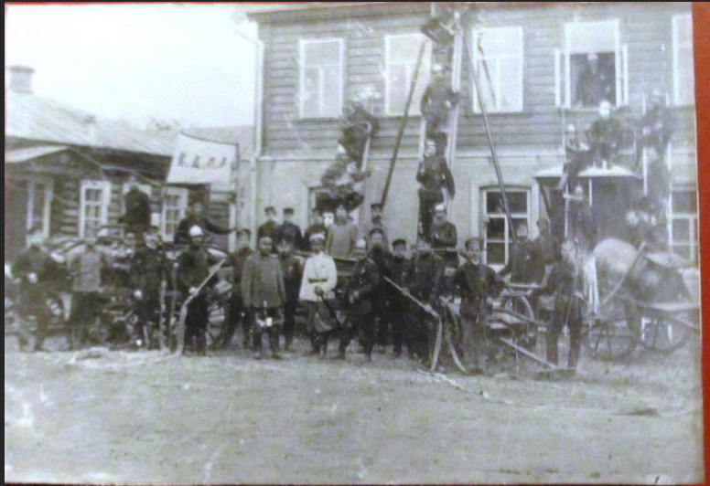
Занятия Добровольной Пожарной Дружины 6 АВГУСТА 1906 г. г. Козлов

История пожарной охраны города Козлова- Мичуринска началась в июне 1901 года. Город Козлов посетил Председатель Российского пожарного общества князь Львов Владимир Александрович и предложил Козловскому Городскому самоуправлению организовать Добровольную Пожарную Дружину.