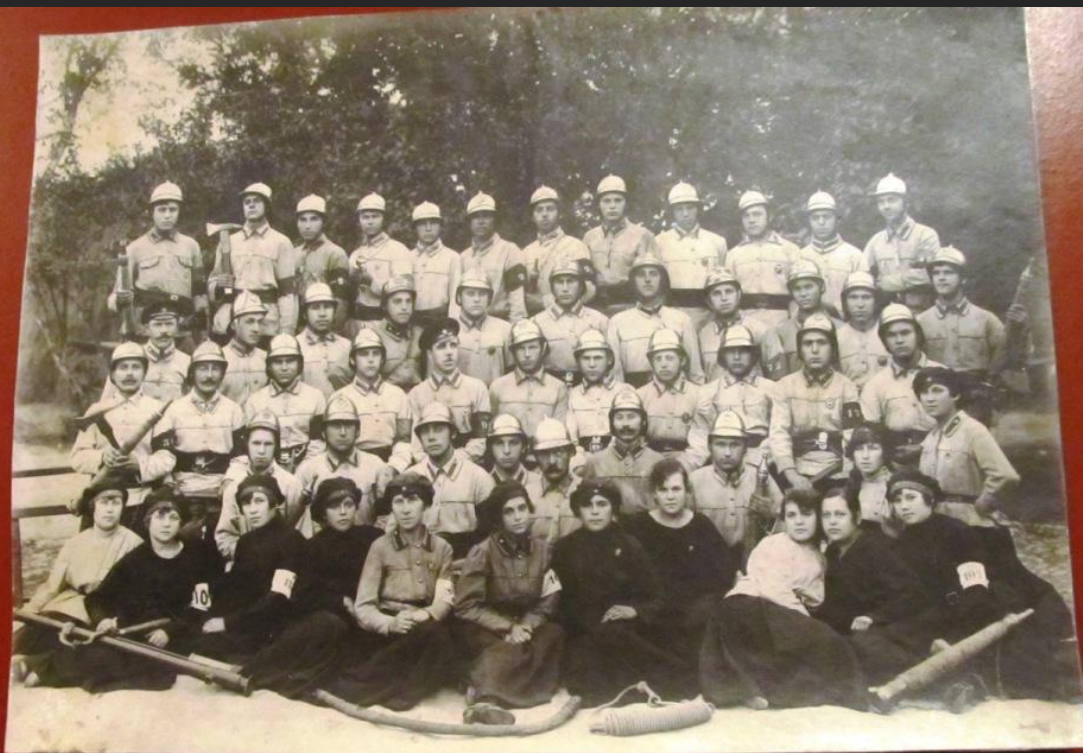
Группа пожарных добровольцев вступивших в дружину с ноября 1917 года.

17 апреля 1918 года Ленин подписал декрет «Об организации государственной дружины борьбы с огнём». С этого времени пожарная охрана разделилась на Всероссийское Добровольное Пожарное Общество и пожарную охрану.