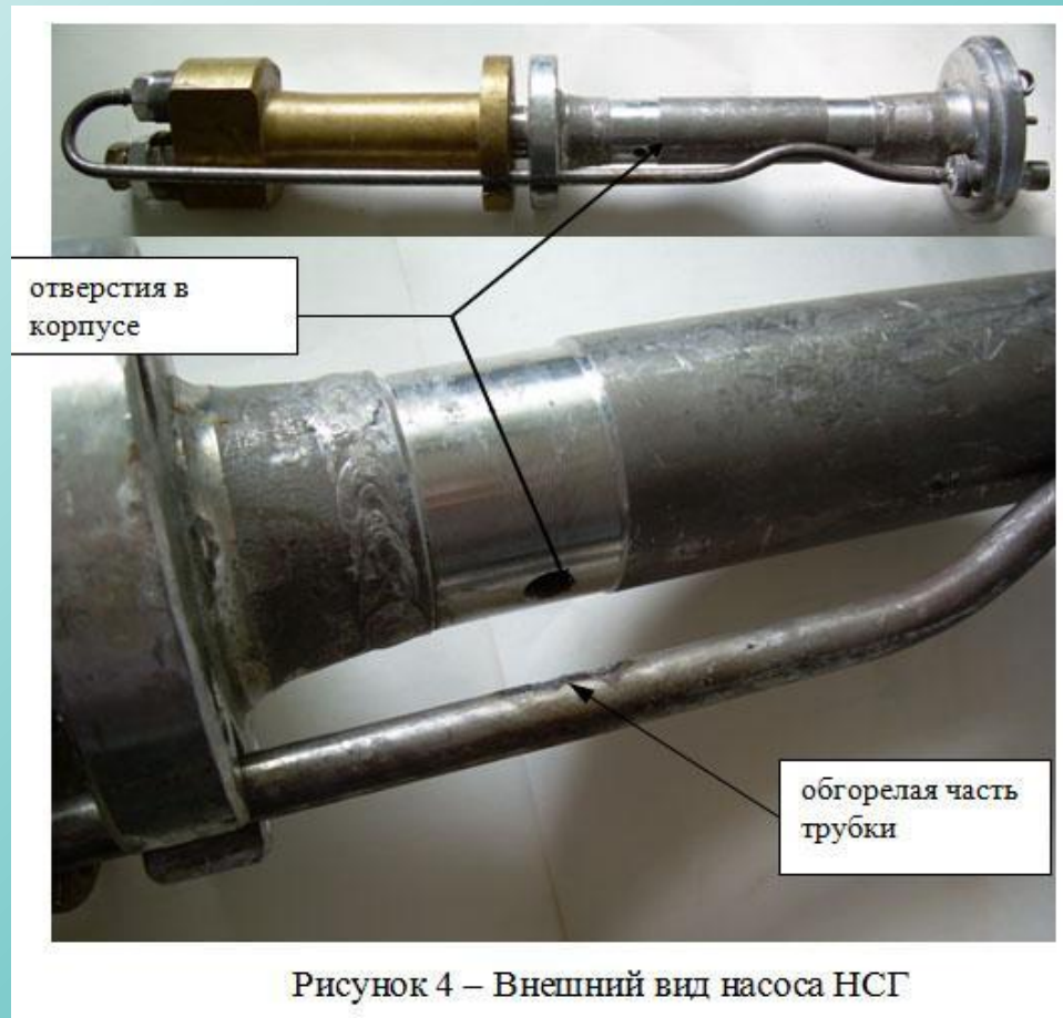
Рисунок 4 – Внешний вид насоса НСГ