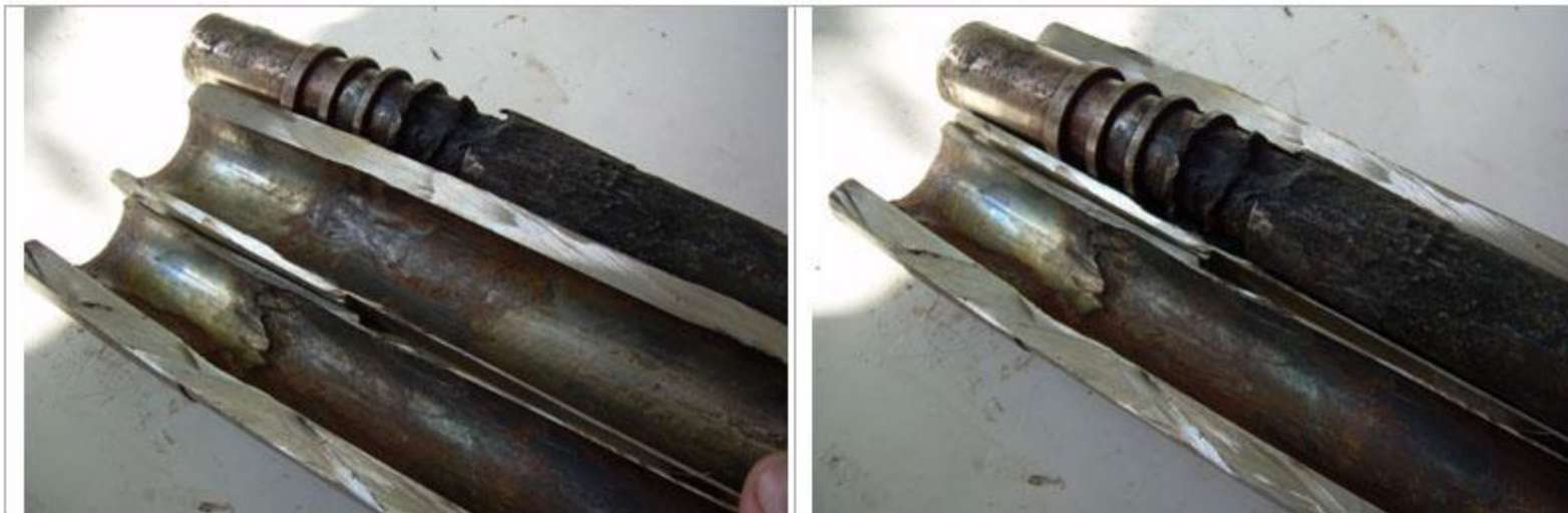
Рисунок 6 – Внешний вид цилиндра с поршнем