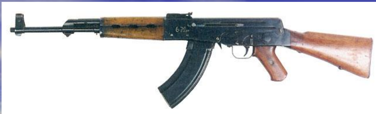
первый опытный автомат Калашникова под патрон 7.62x41, 1946 год, также известный как AK-46