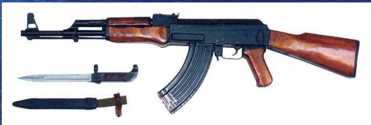
серийный автомат Калашникова АК выпуска после 1951 года, с фрезерованной ствольной коробкой