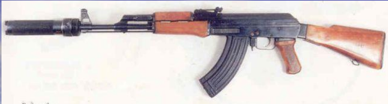
серийный автомат Калашникова АК выпуска после 1951 года, в варианте для Спецназа, укомплектованный глушителем ПБС-1