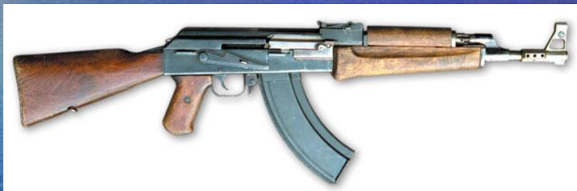
первый опытный автомат Калашникова 1947 года, также известный как AK-47