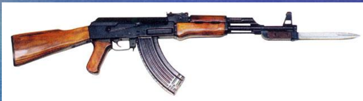
серийный автомат Калашникова АК выпуска после 1951 года, с фрезерованной ствольной коробкой