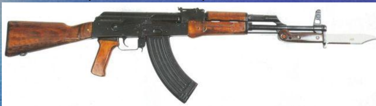
серийный автомат Калашникова модернизированный АКМ раннего выпуска