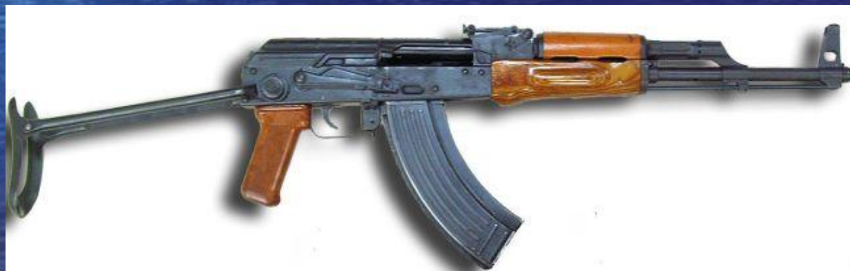
серийный автомат Калашникова модернизированный со складным прикладом АКМС