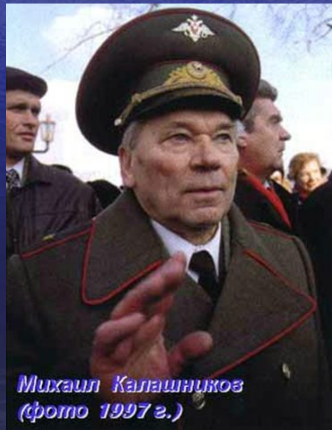
Михаил Калашников (фото 1997 г.)

В 1959 году автомат Калашникова модернизировали, и новая модель получила название АКМ (автомат Калашникова модернизированный). У АКМ масса уменьшилась на 700 г., был введен новый штык-нож. В 1974 году на смену АКМ официально принимается на вооружение система оружия под новый, малокалиберный патрон калибра 5.45мм - АК-74, АКС-74. У варианта АКС/АКСМ вместо деревянного устанавливается металлический приклад, складывающийся вниз.