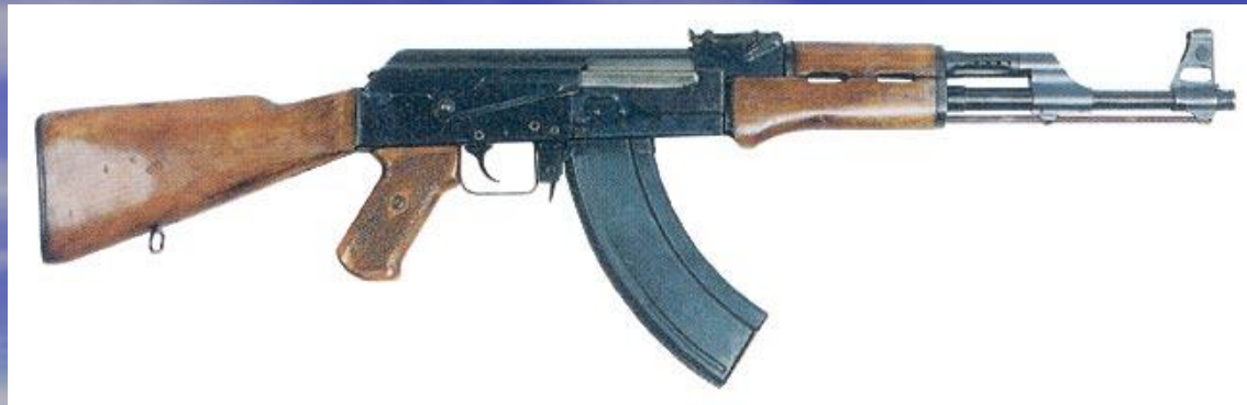
серийный автомат Калашникова АК выпуска 1949-51 годов, со штампованной ствольной коробкой