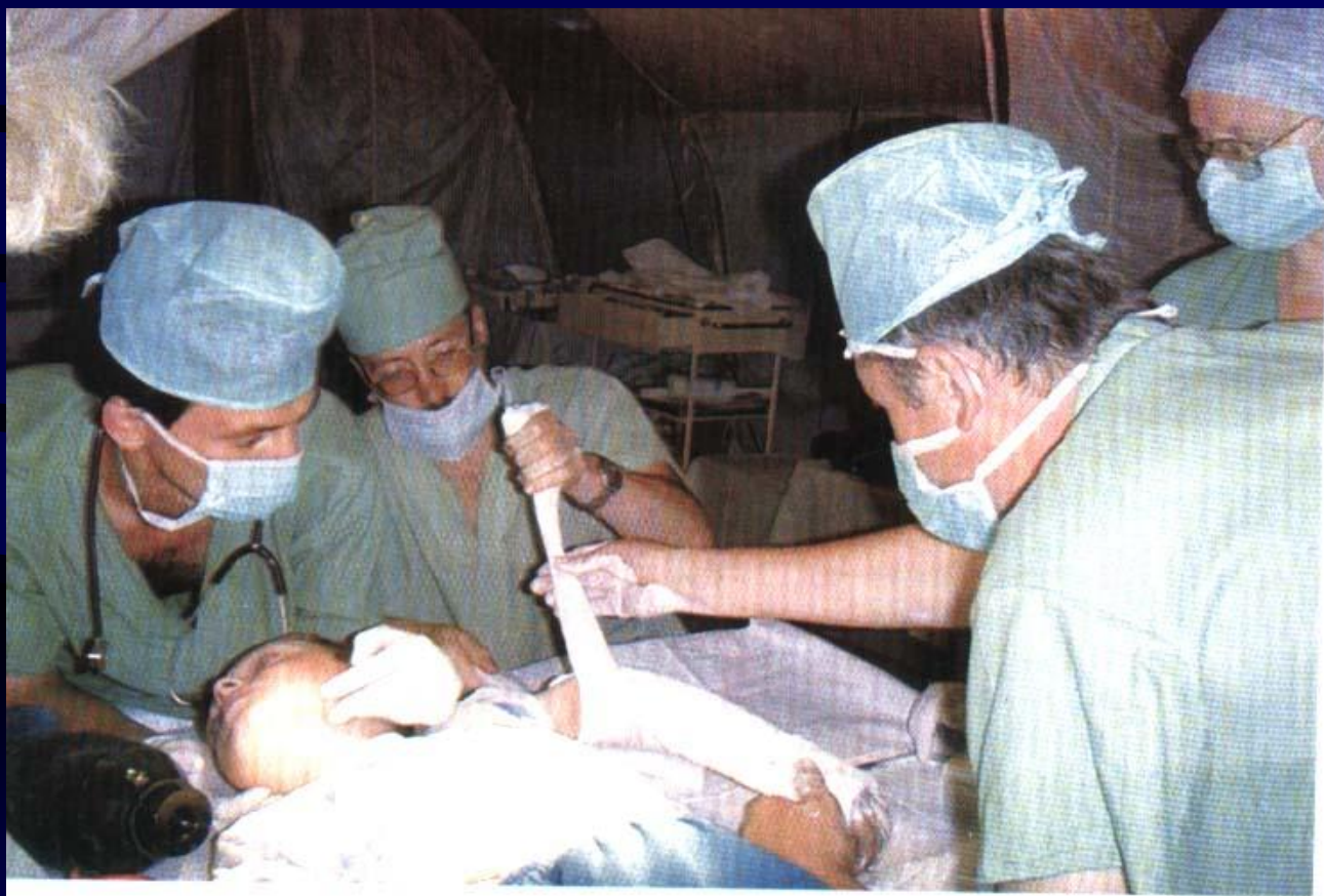
Фото 3. Оказание квалифицированной медицинской помощи в полевом