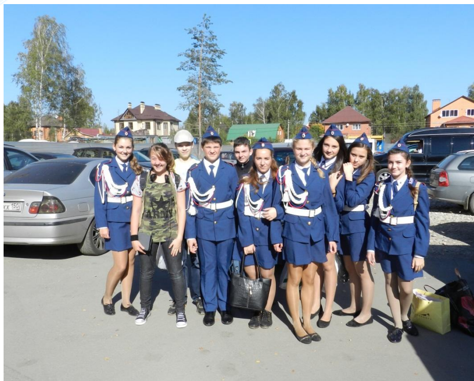
Отряд ЮИД г. Раменское «СВЕТ»