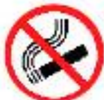
Отказ от курения

Для нормализации артериального давления: