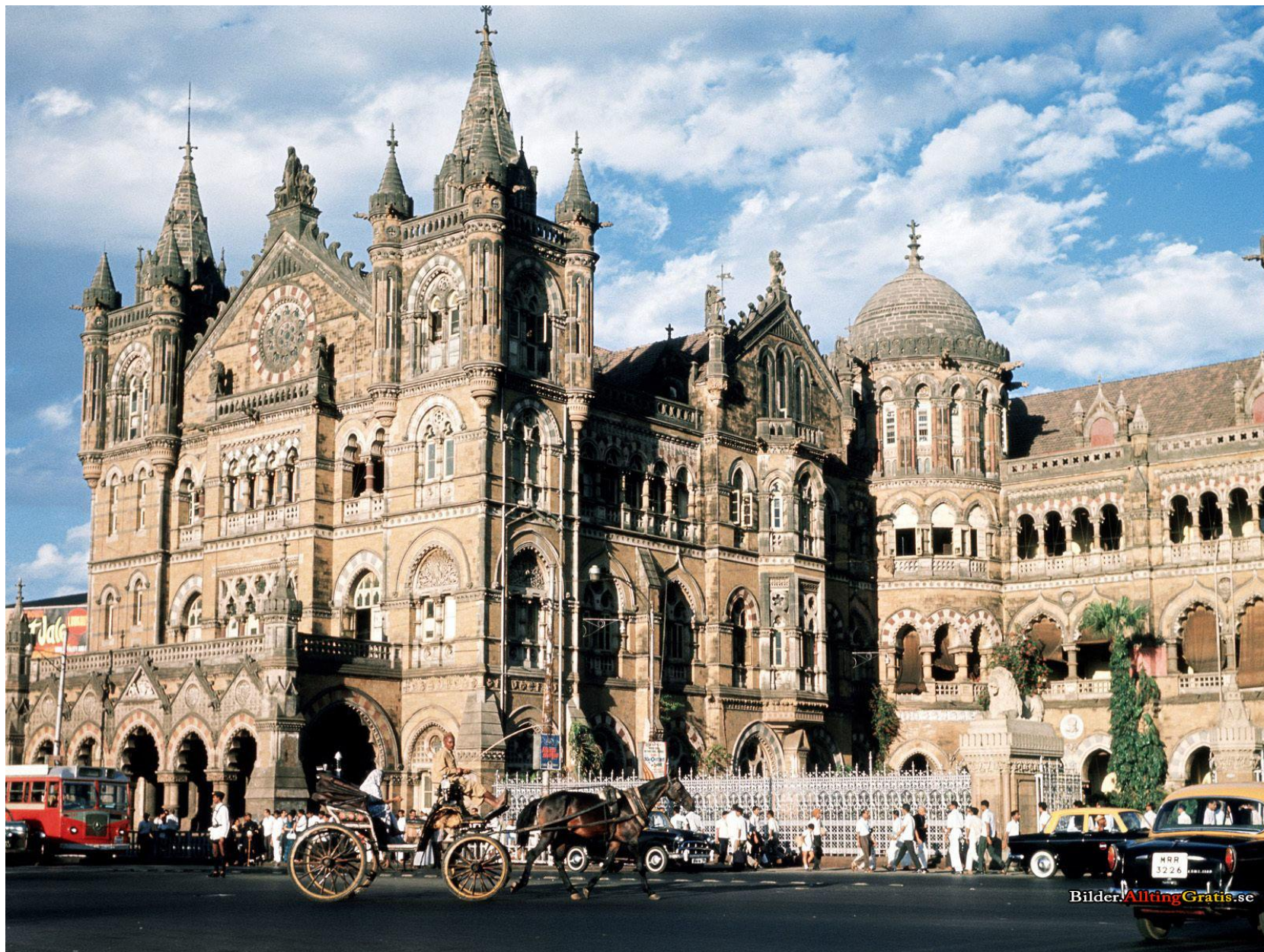
Вокзал Виктория (Чхатрапати Шиваджи Терминус)