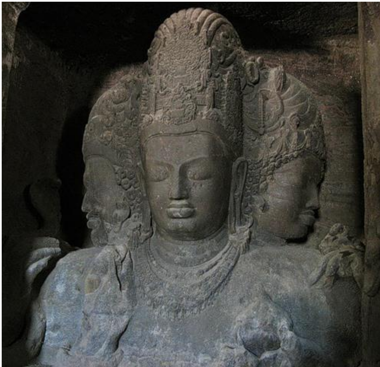
Бюст трёхликого Шивы