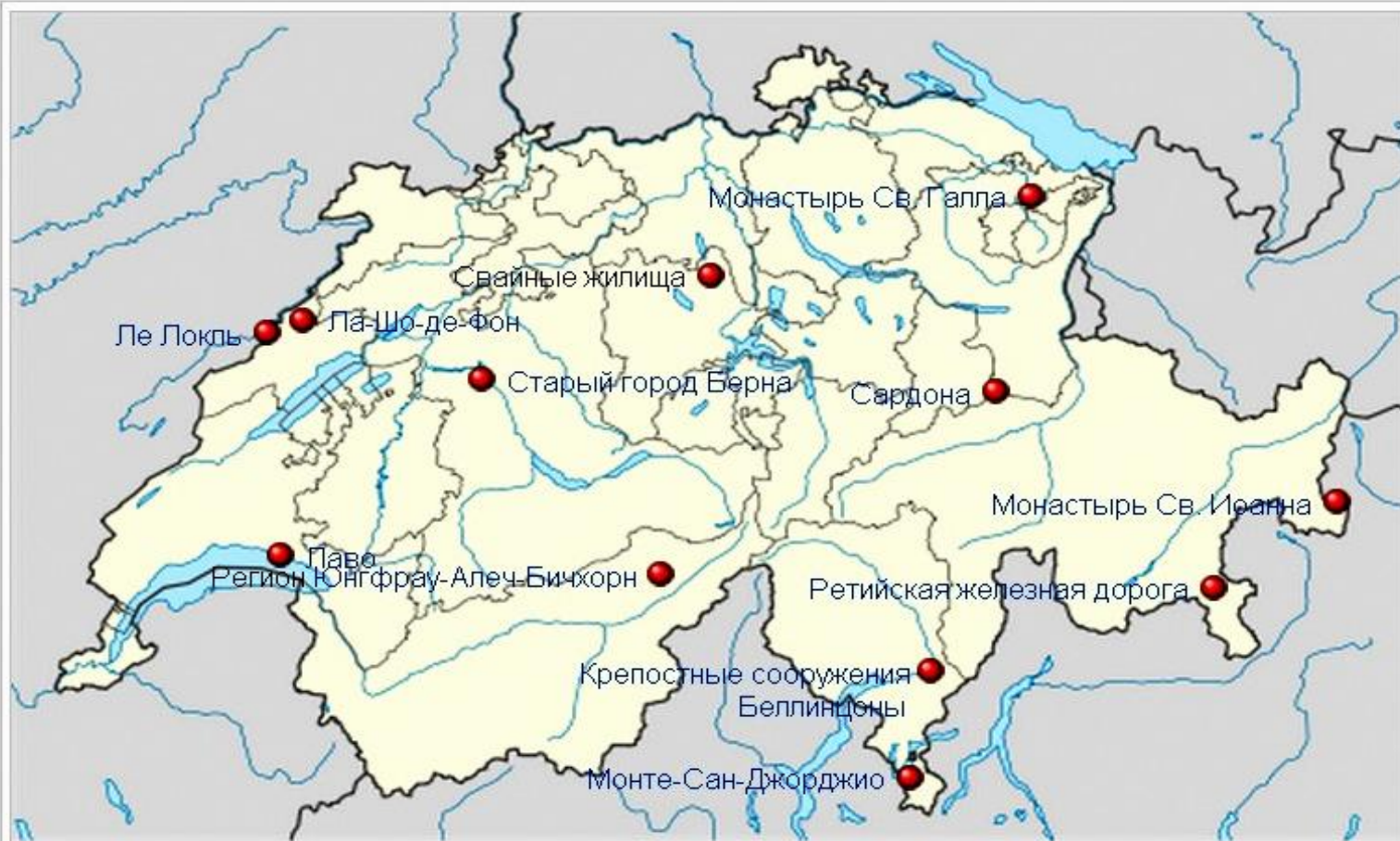
Объекты Всемирного наследия ЮНЕСКО в Швейцарии