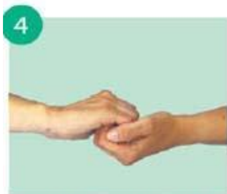
тереть тыльной стороной согнутых пальцев по ладони другой руки