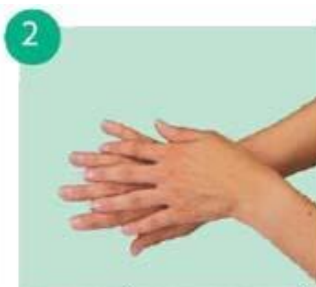
тереть левой ладонью по тыльной стороне правой кисти и наоборот