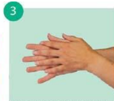
тереть ладони со скрещенными растопыренными пальцами