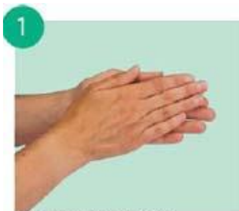
тереть ладонью о ладонь