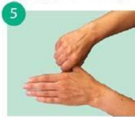
круговыми движениями тереть большие пальцы рук