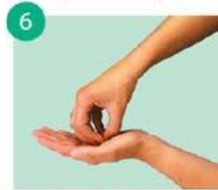
круговыми движениями тереть ладонь кончиками пальцев другой руки