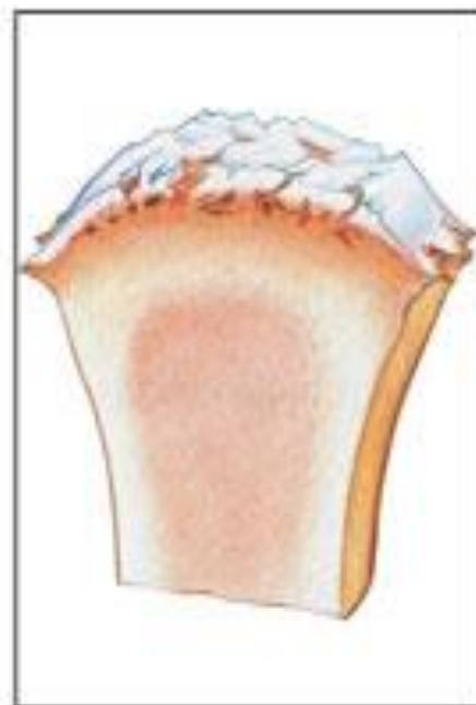
Развернутая стадия остеоартроза