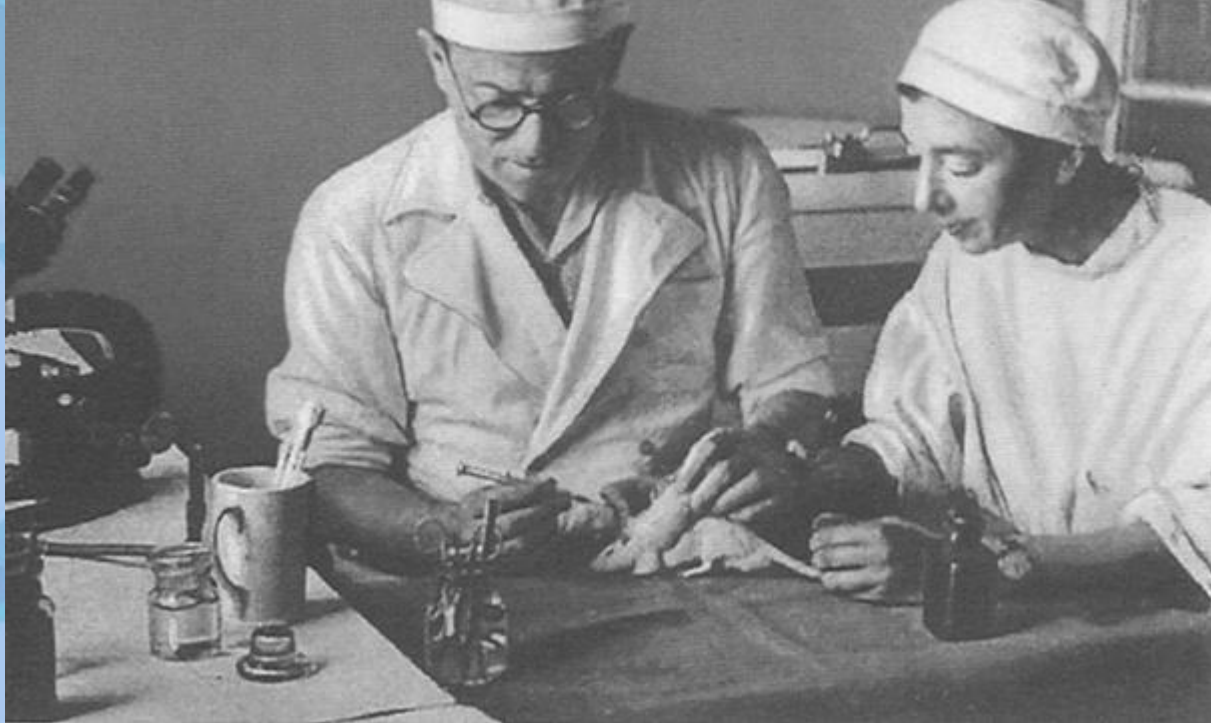
Зильбер Лев Александрович