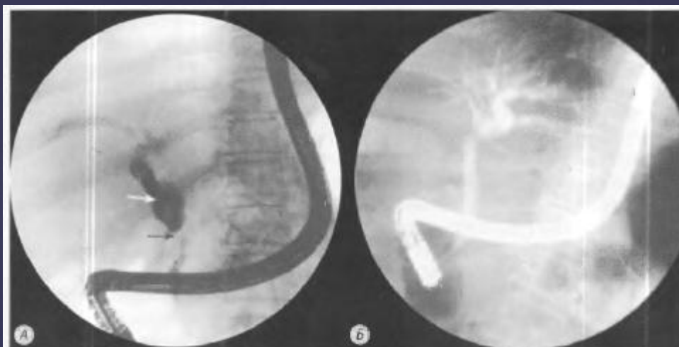
Рис. 20.1. Эндоскопическая ретроградная холангиопанкреатикография.

А — стеноз общего желчного протока; в проксимальной части он резко расширен (белая стрелка), в средней части сужен (черная стрелка); Б — после 3 мес. противотуберкулезной терапии [13]