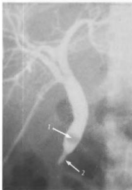
Рис. 20.3. Холангиография. Стриктура терминального отдела общего желчного протока (2); внутри- и внепеченочные желчные протоки диффузно расширены, в терминальном отделе холедоха одиночный конкремент (1); желчный пузырь удален