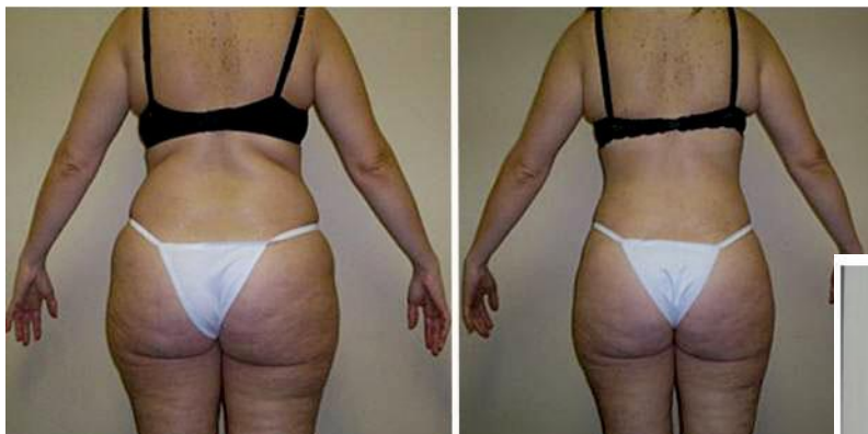
Фото До и После