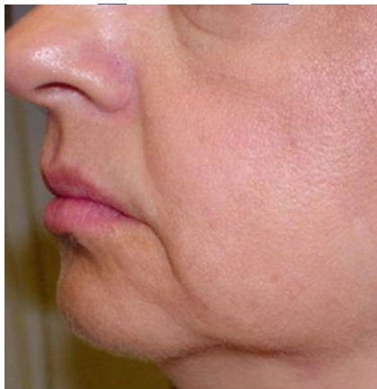
Фото До и После: