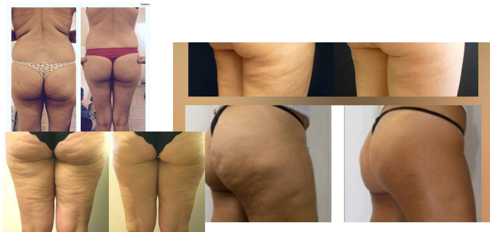
Фото До и После: