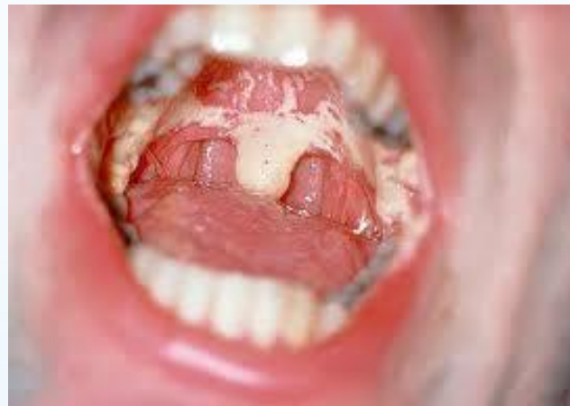
СПИД-тің ауыз қуысындағы көрінісі