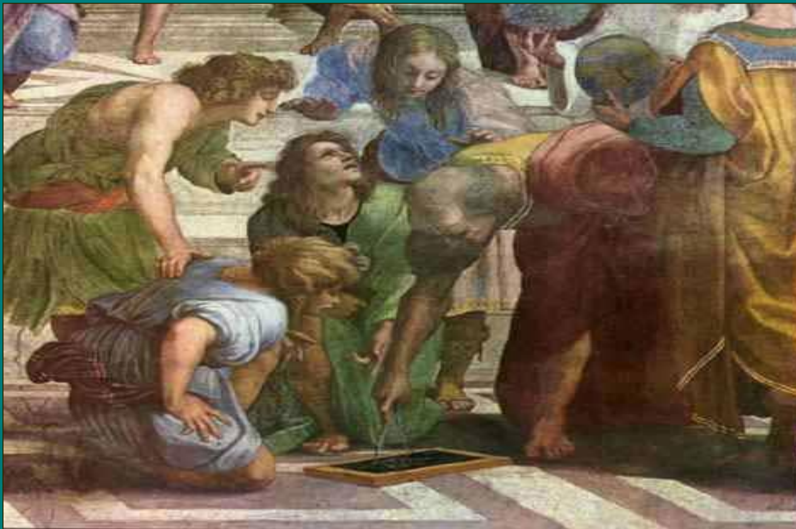
Рафаэль Санти, Евклид, деталь 1508-11, фреска "Афинская школа" Станц делла Сеньятура, Ватикан, Рим, Италия.