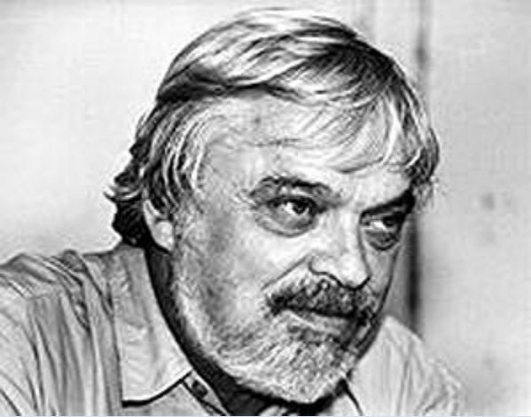
И. Ф. Шарыгин