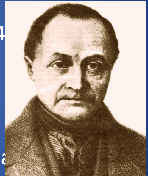
О. Конт 1798 - 1857