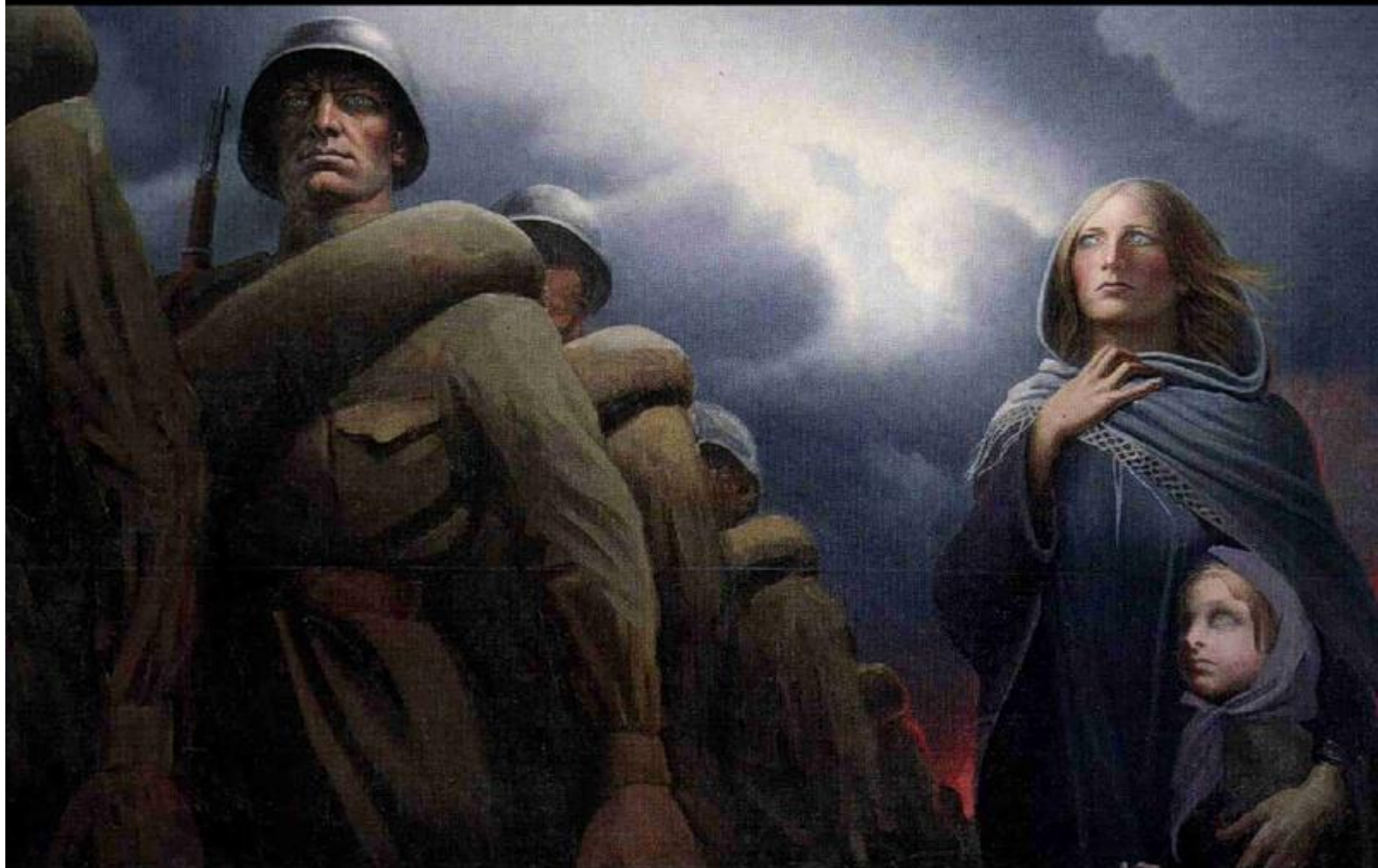
Константин Васильев. Прощание славянки. Холст, масло. 1974