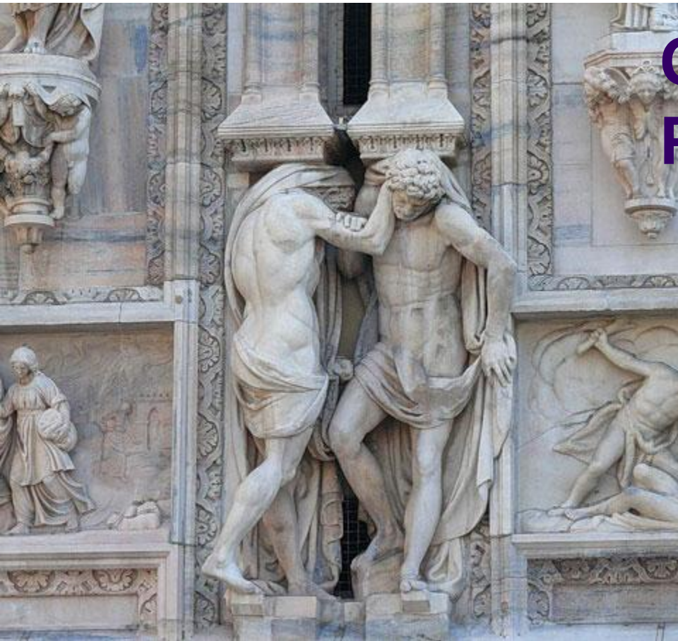
Скульптура на фасаде Миланского собора