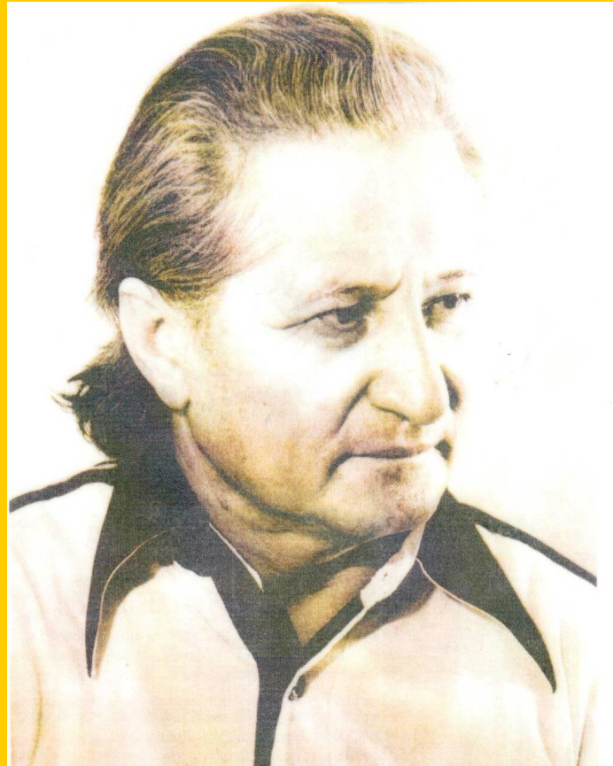
Қадыр Мырза Әли (1936 жылы туған)