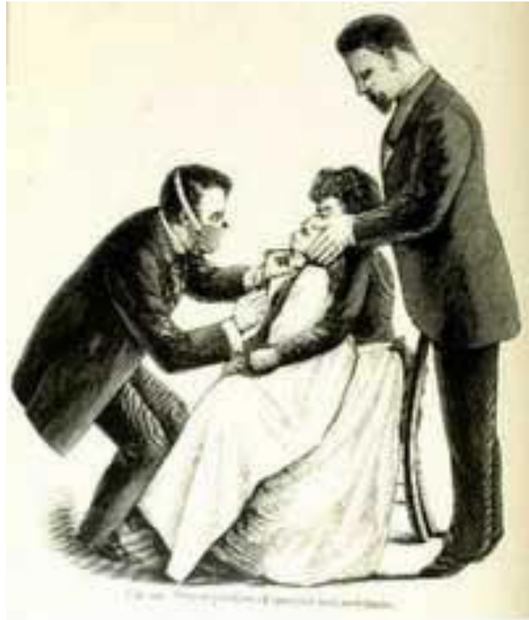
Intubating a Child