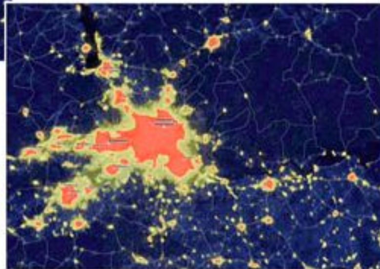
Групповая система населенных мест Нижнего Новгорода - Нижегородская агломерация