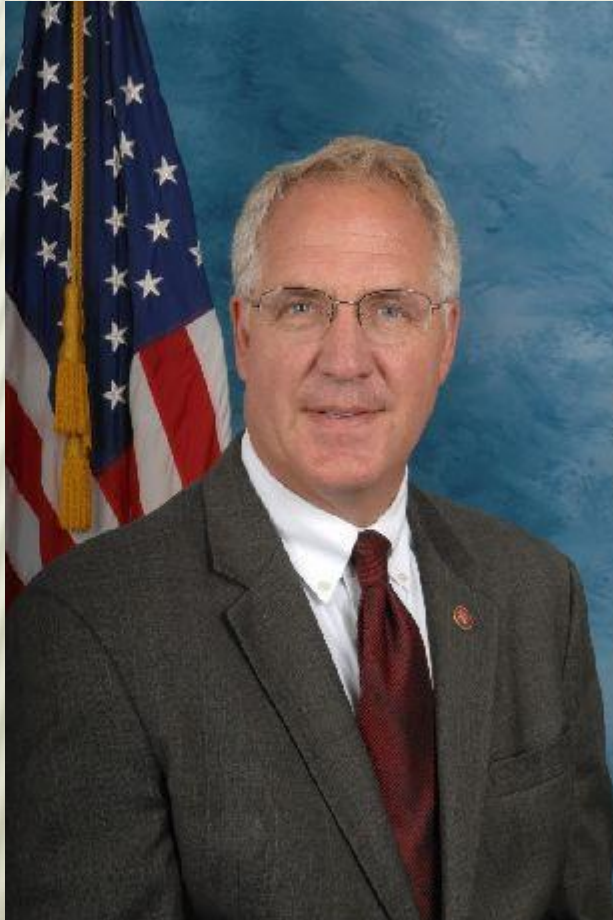
Джоном Ф. Мут

Теория рациональных ожиданий — концепция макроэкономики, изначально разработанная Джоном Ф. Мутом в 1961 году и развитая Робертом Лукасом в середине 1970-х годов (за которую Лукасу в 1995 году была присвоена Нобелевская премия по экономике)