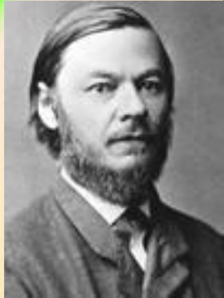
Сеченов Иван Михайлович