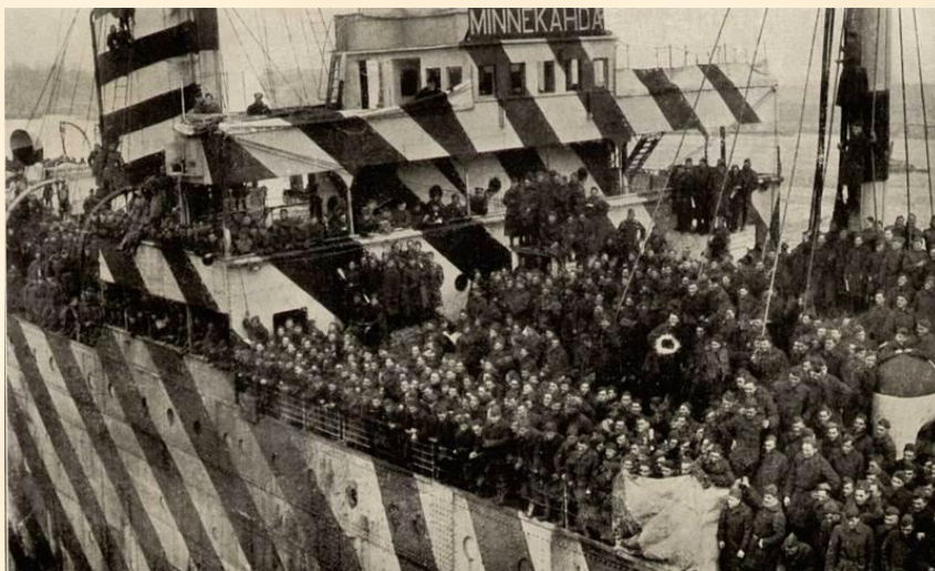
Победоносные американские войска возвращаются домой