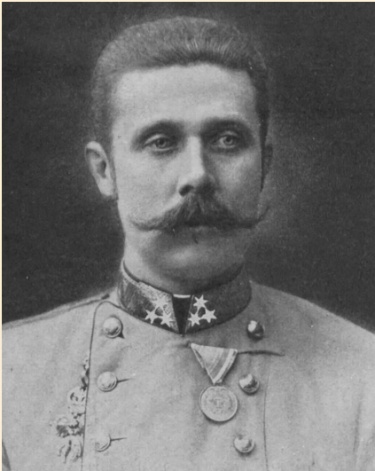
Эрцгерцог Франц Фердинанд

Общепринято, что непосредственно поводом к началу военных действий явилось Сараевское убийство 28 июня 1914 г. эрцгерцога Франца Фердинанда сербским националистом Гаврило Принципом.