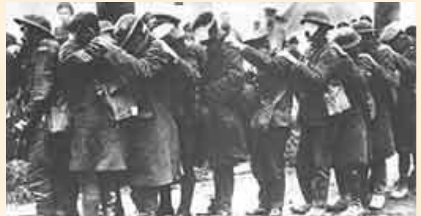
Пострадавшие от газовой атаки английские солдаты