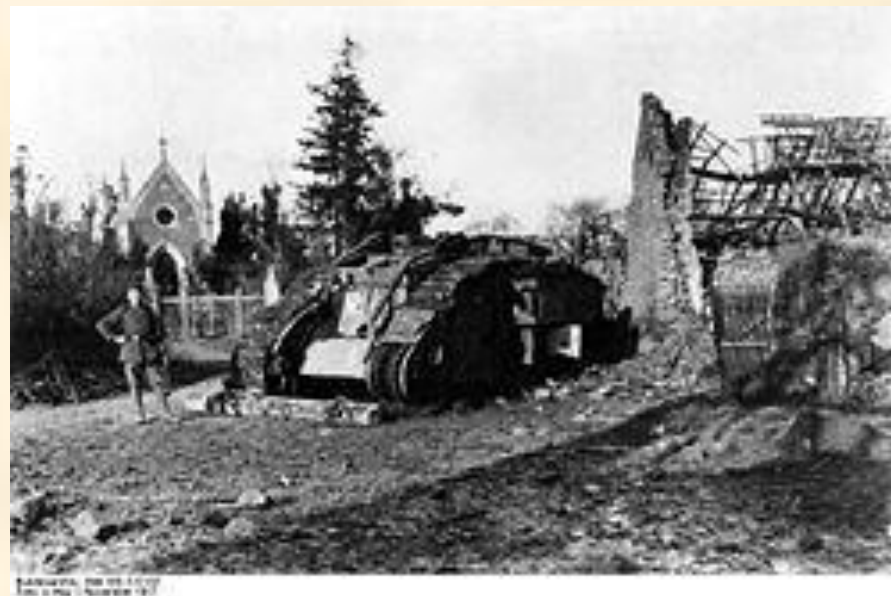
Подбитый английский танк