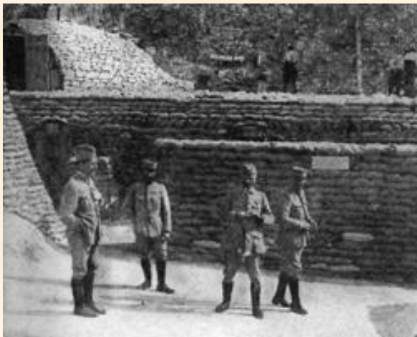
Французские оборонные сооружения, Сомма, 1916 г.