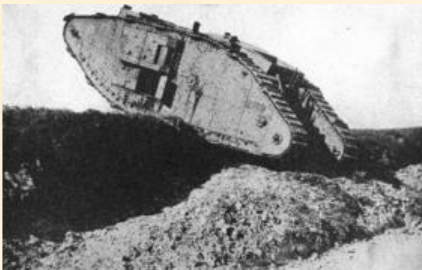
Британский танк пересекает германскую траншею