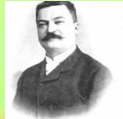
Франсуа Эдуард Анатоль Люка (1842-1891)

Для того, чтобы переместить башню из 64 дисков, при безошибочной работе потребуется 18 446 744 073 709 551 615 перекладываний. Если считать, что на одно перекладывание уходит одна секунда, то решить эту задачу возможно за 580 миллиардов лет .