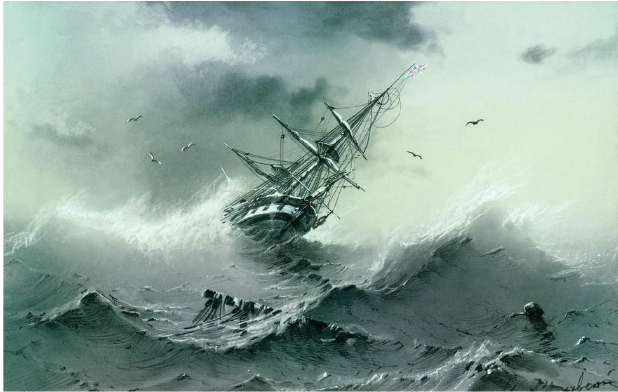
Айвазовский И. К. Тонущий корабль 1854. 19,5x28,8. Карандаш Русский музей. Санкт-Петербург

Серо-ультрамариновая палитра пасмурного, штормового дня врывается плеском косматых волн в реальность. Критически накренившийся корабль несётся на нас, но мы понимаем, что в глазах команды – острые рифы, уже погубившие не одно судно. Остатки корабля, шедшего впереди, виднеются на первом плане картины. Рваные паруса на сломанной мачте сливаются с сизо-стальными волнами.