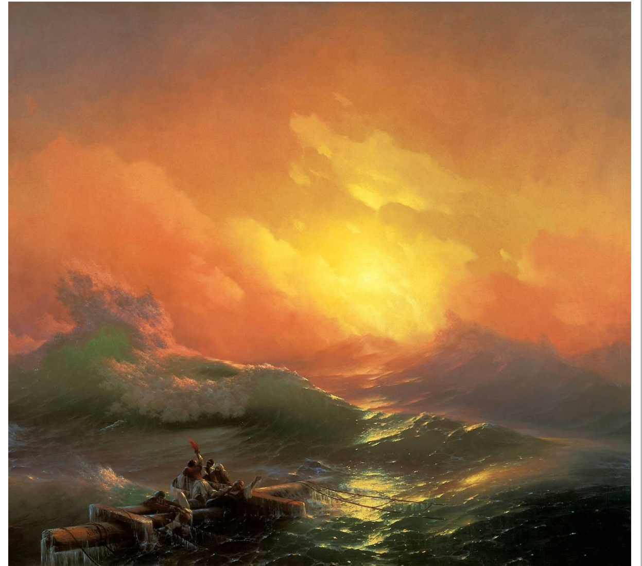
Айвазовский И. К. Девятый вал . 1850. Холст, масло. 221x332 см Русский музей. Санкт-Петербург

Такие произведения создаются в счастливые моменты творческого подъема. Вслед за картиной Айвазовский написал целую серию «бурь» (Корабль среди бурного моря, Радуга). Они чередуются с изображениями спокойного элегического моря, выдающего в их авторе последнего представителя живописи эпохи романтизма.