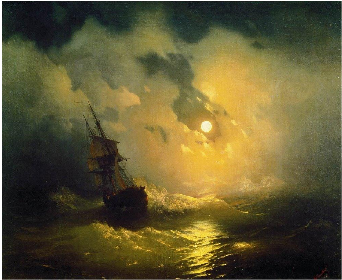
Айвазовский И. К. Буря на море ночью. 1849. Холст, масло. 89х106 Петергоф (музей-заповедник)

Бурное море и яркая луна в просвете туч – необыкновенное сочетание, определяющее колорит этой картины Айвазовского. Ночная буря, захватившая корабль, грозна, но прекрасна. Природная стихия опасна для человека, но мы всё равно восхищаемся удивительной красотой её дерзкой силы.