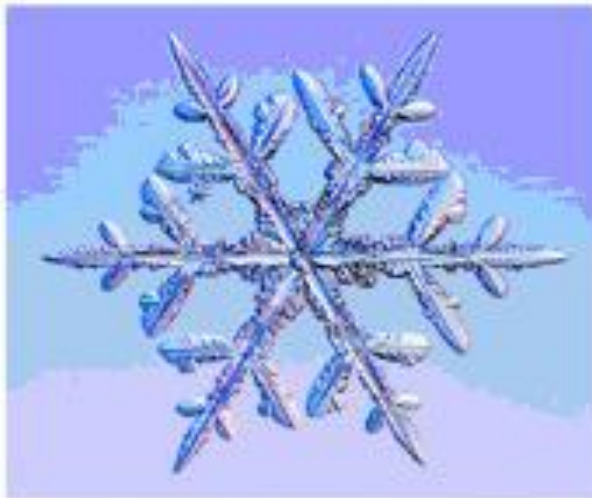
Звездная ветвящаяся снежинка