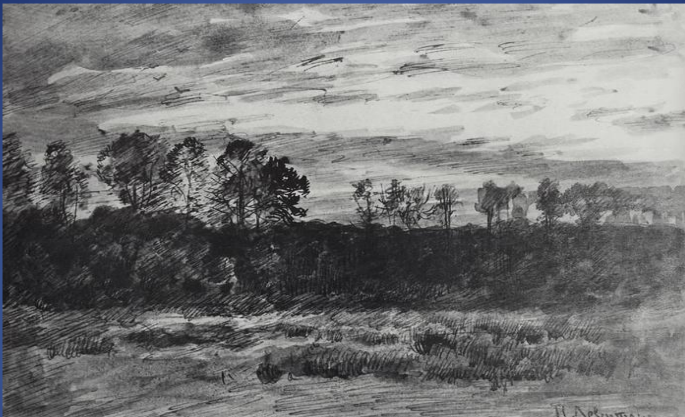
Левитан «Вечер. Закат»