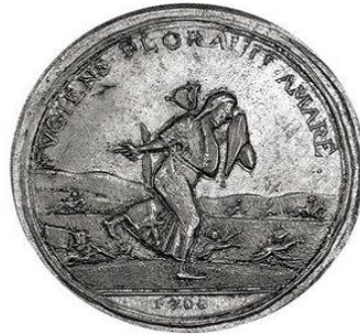
Шведская медаль в память разгрома русской армии под Нарвой.