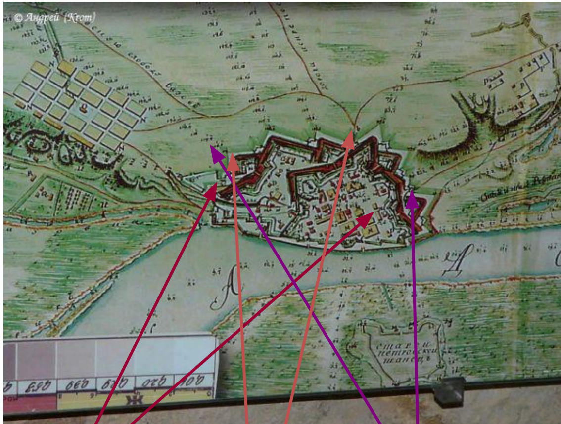
План крепости Азов.