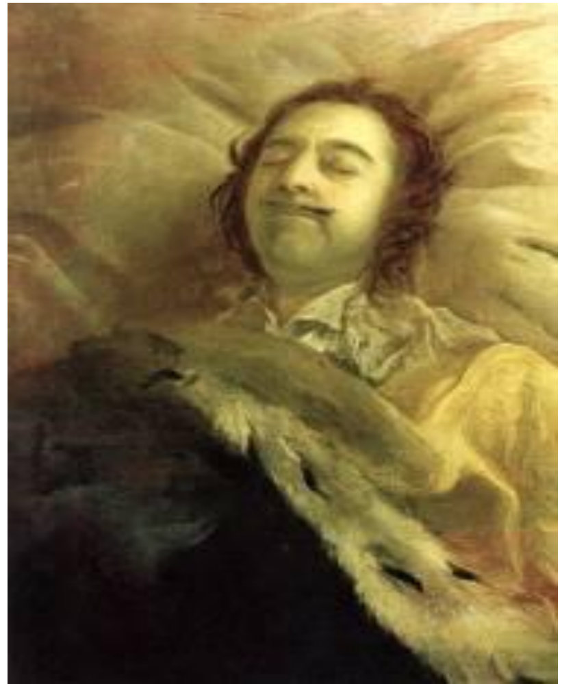
И. Н. Никитин «Пётр I на смертном одре»