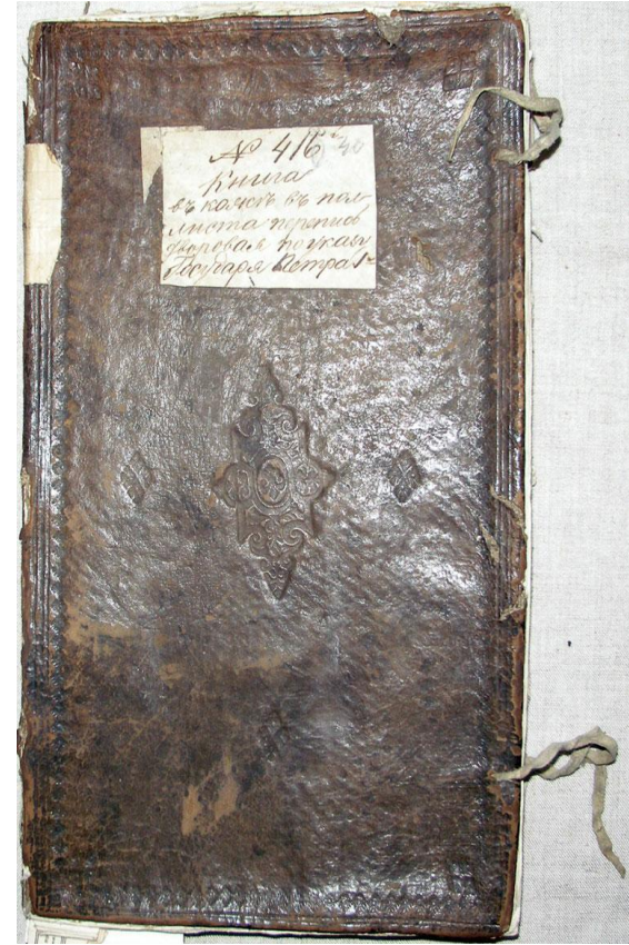
Переписная книга Антониева-Сийского монастыря. 1718 г.

Помимо подушной взимались также различные разовые платежи (на строительство флота, дорог) и натуральные повинности (строительная, подводная, дорожная и др.).