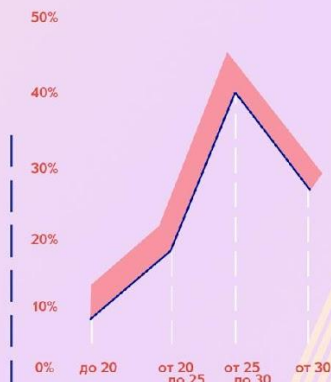
Возраст участников форума