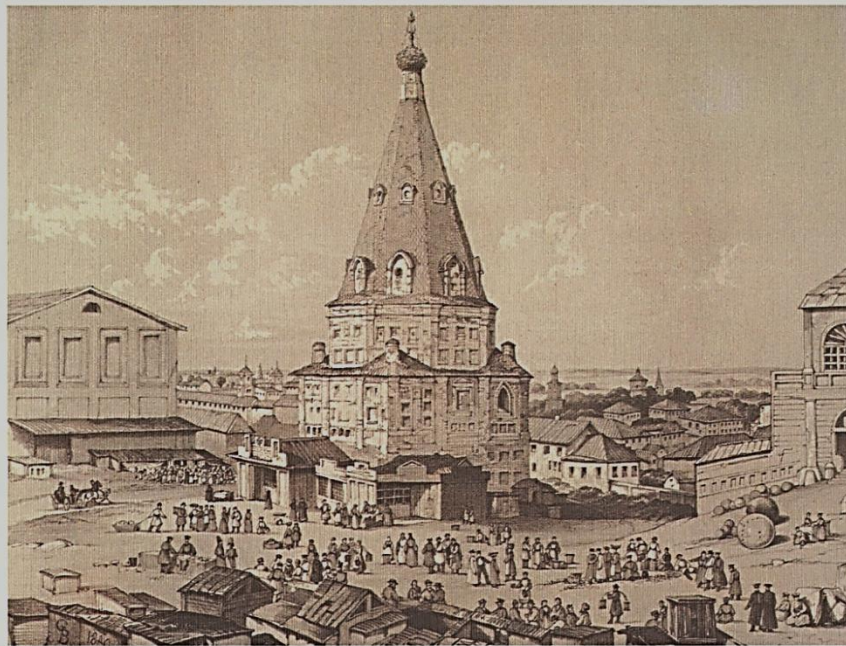
Э.Турнерелли 8. Кунак саркендагы манара Edward P. Turnerelli Башня в Гостином дворе Tower in the market place. Kazan