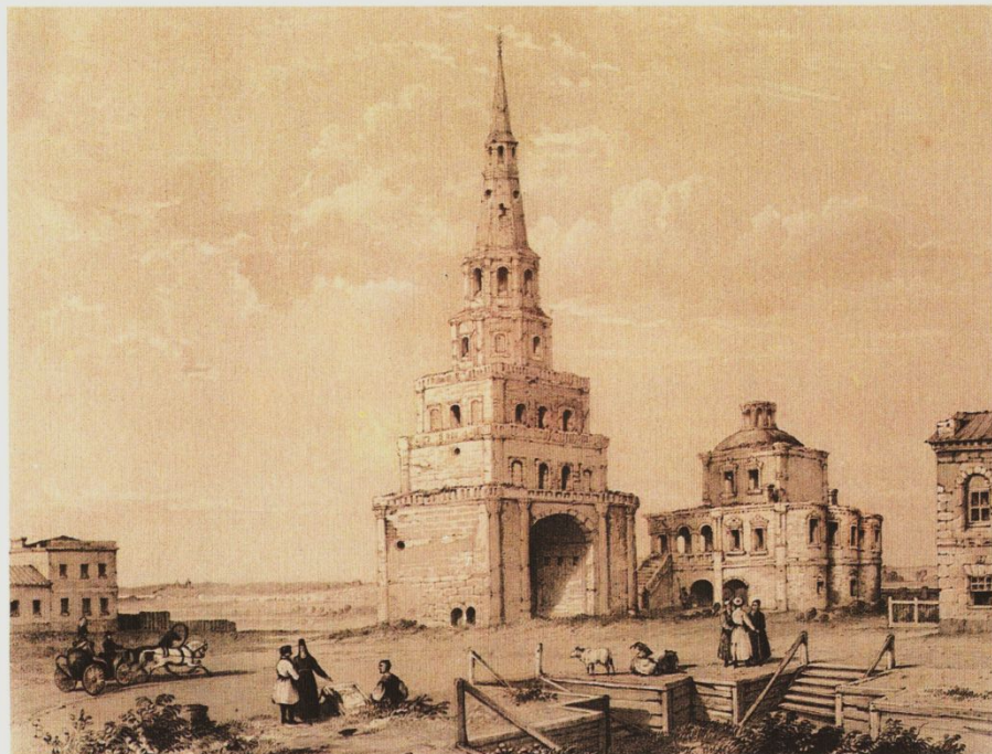
Э.Турнерелли 2. Соембикэ манарасы Edward P. Turnerelli Ташня Сююмбеки Tower of Siumbika