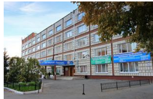
Корпус «К» (пр. Красноармейский, 90)