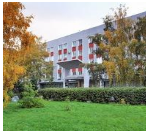
Корпус «Д» (ул. Димитрова, 66)