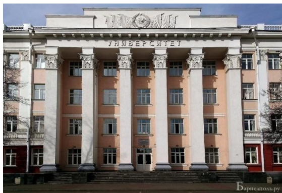
Корпус «Л» (пр. Ленина, 61)