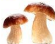
Белый гриб (боровик)