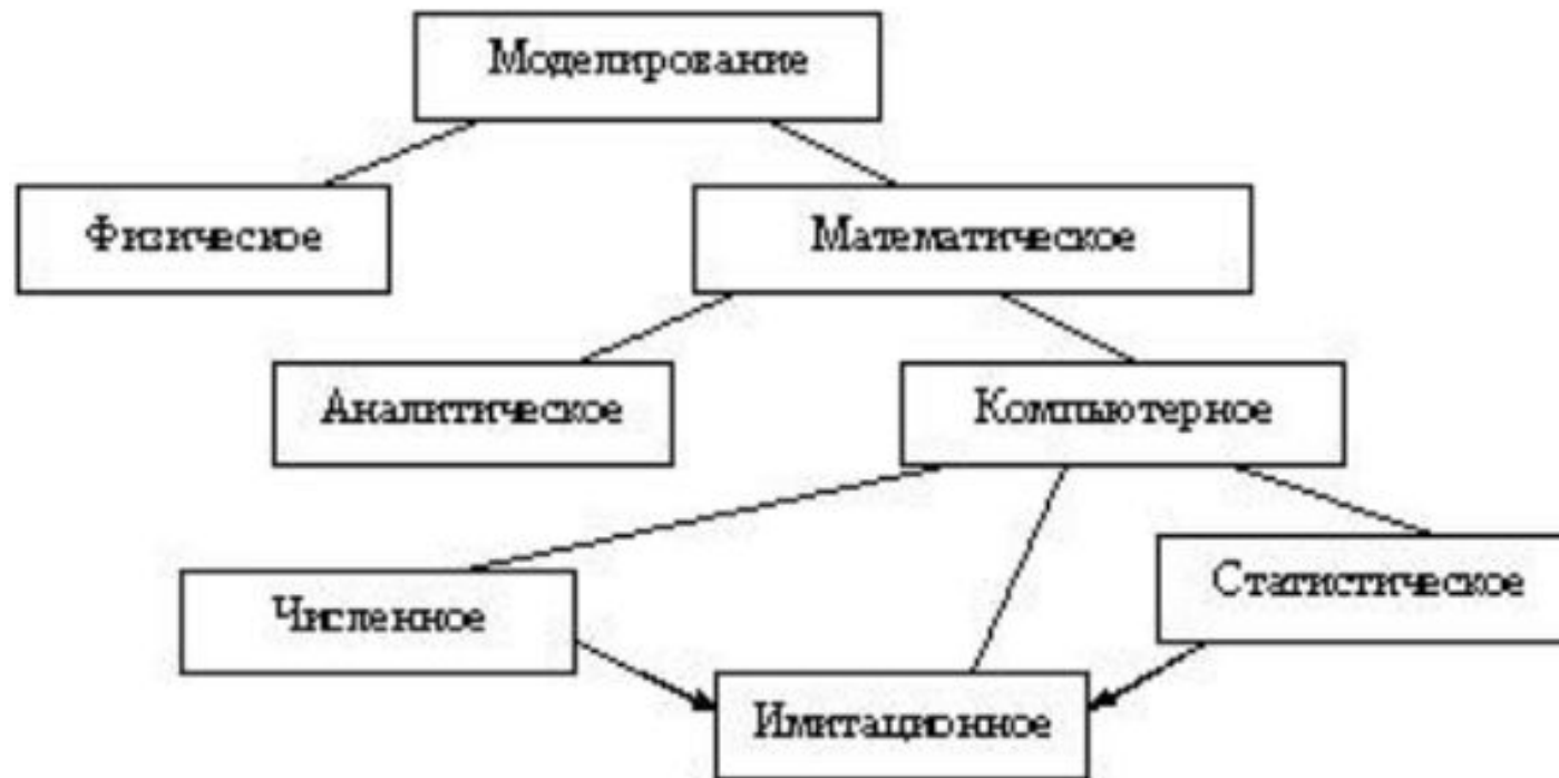
Рисунок 3 – Виды моделирования