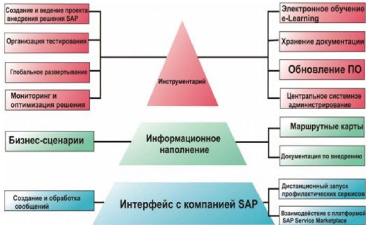
Рисунок 1 - Структура SAP Solution Manager