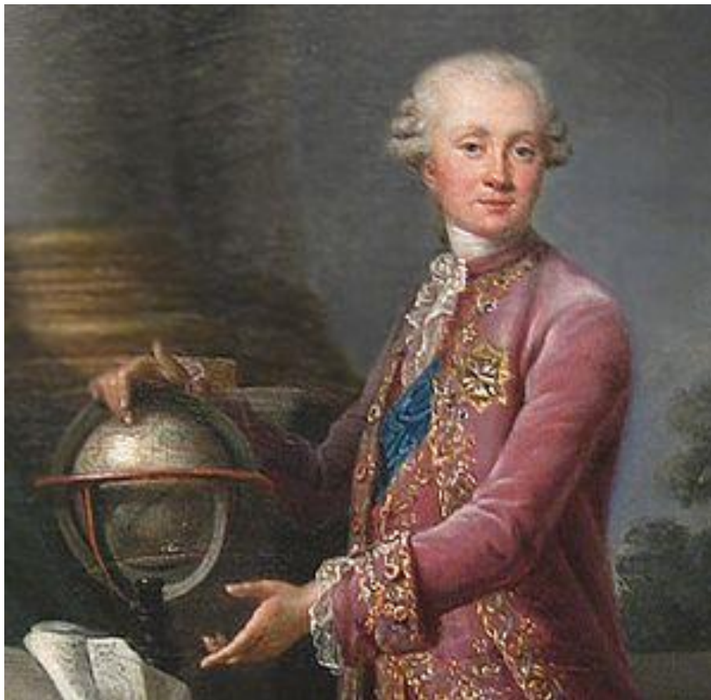
Наум Акимович Синявин (1680 – 1738)