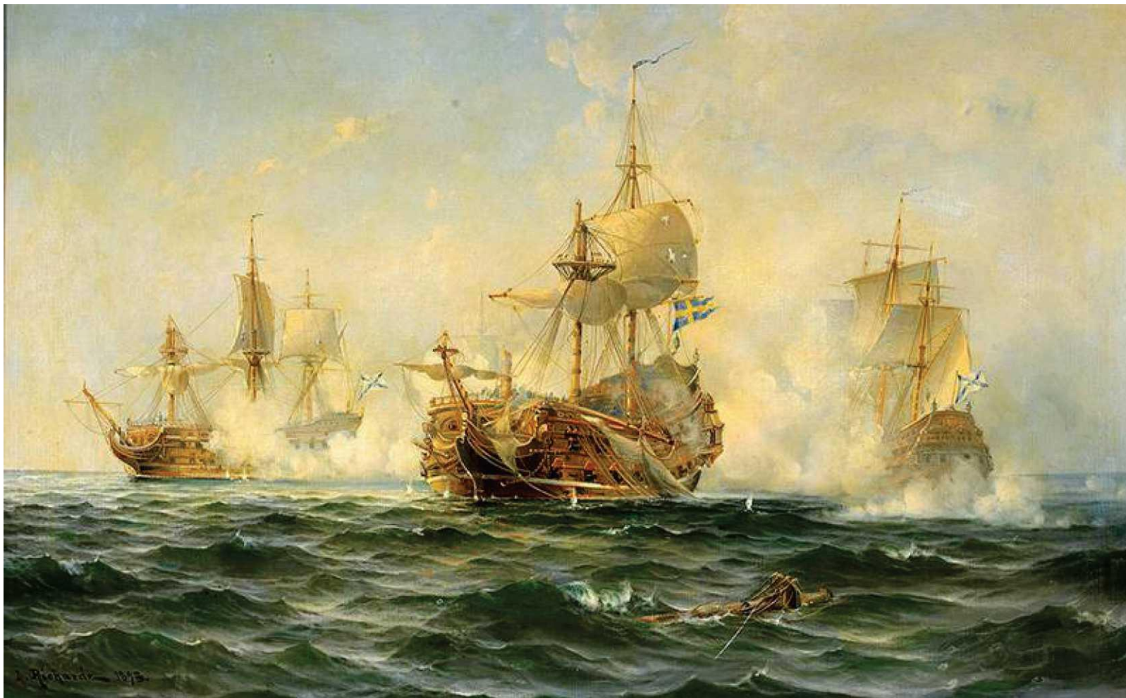
Шведский линейный корабль «Вахмейстер»