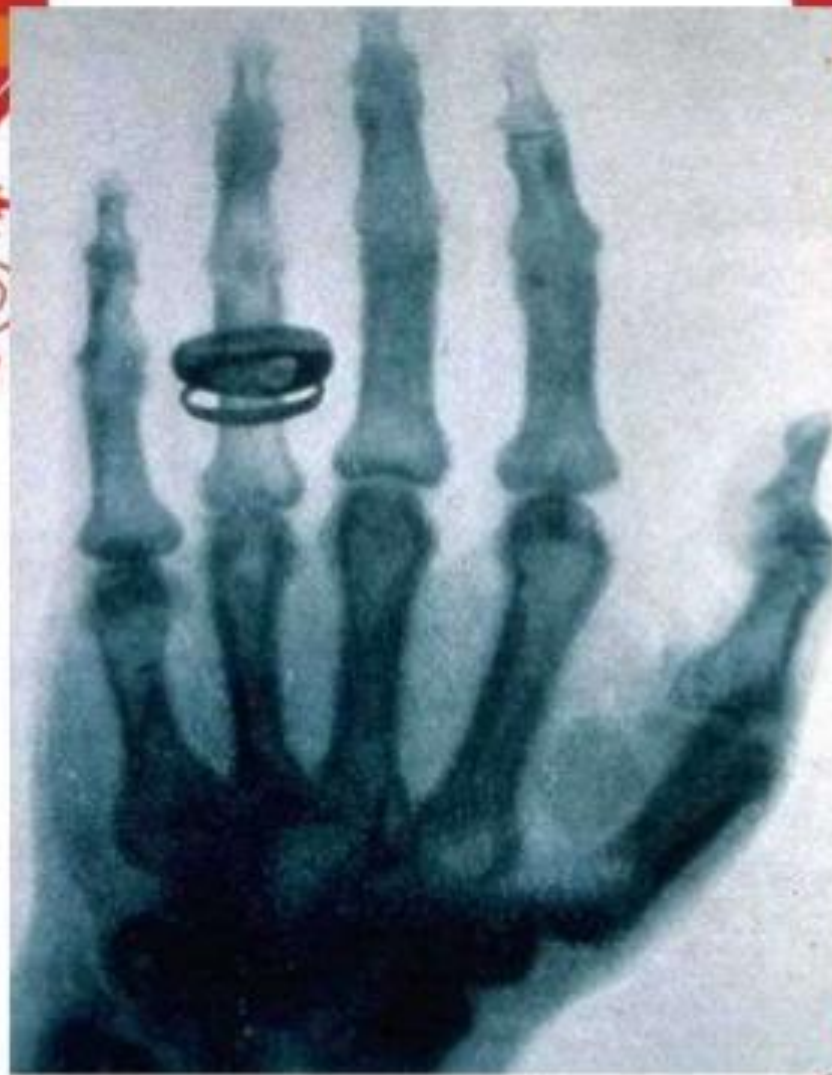
Ең алғашқы рентгендік сурет