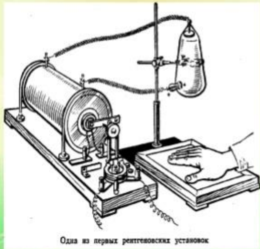
Одна из первых рентгеновских установок