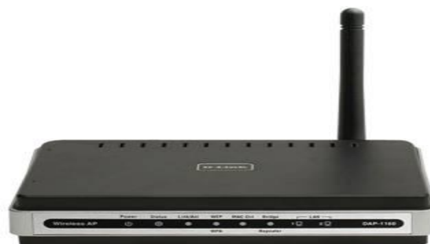
Беспроводная точка доступа