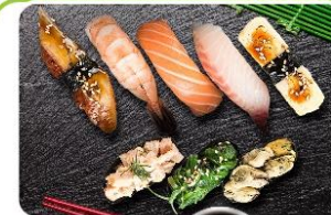
Суши Ассорти 550.0р.