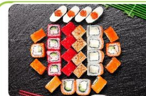
Ассорти мацури 350.0р.