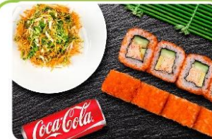
Сет из Запеченных 250.0р.