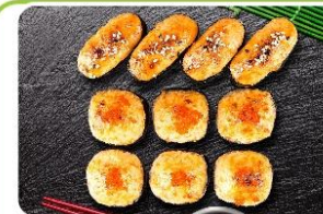
Запеченный сет 250.0р.