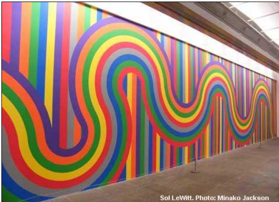
Sol LeWitt. Photo: Minako Jackson