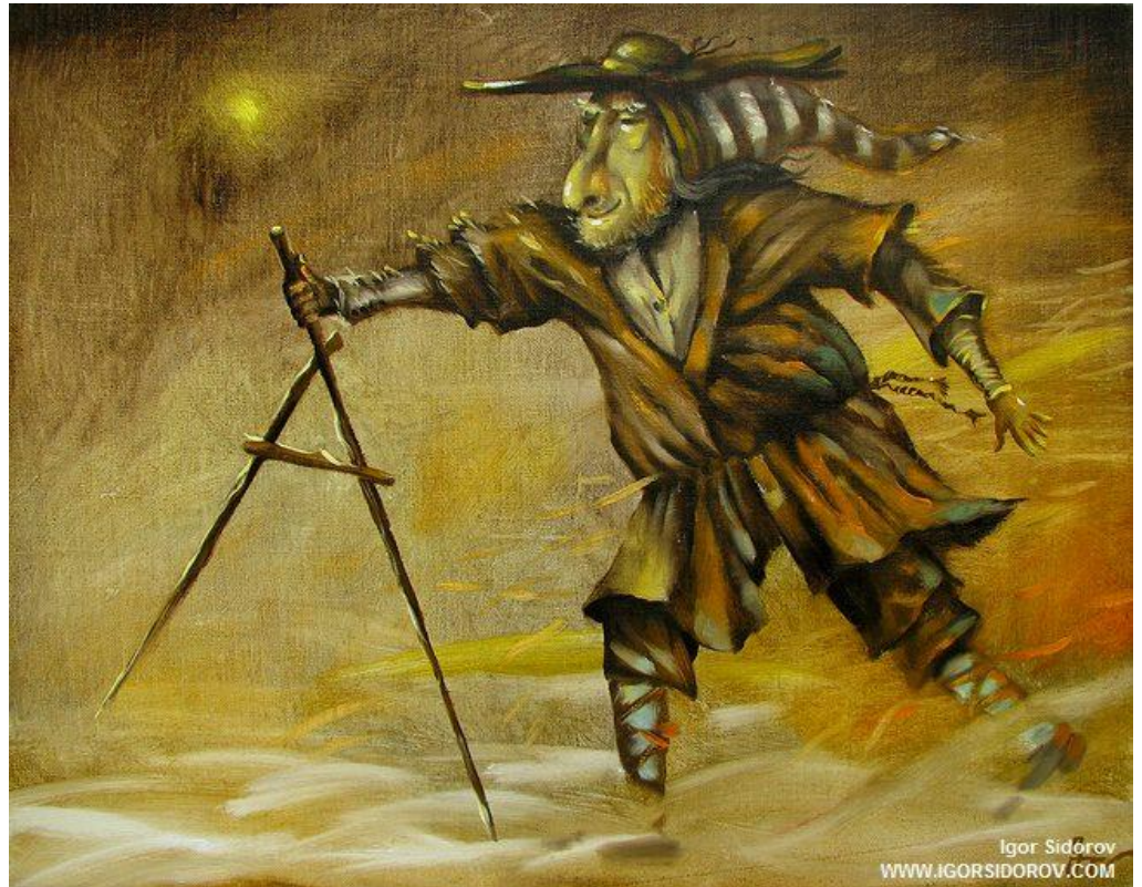
грец. μετρέω -- вимірюю