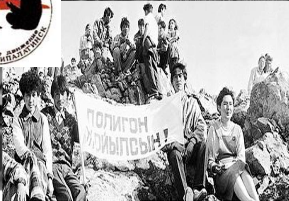
Олжас Сулейменов. На митинге антиядерного движения "Невада-Семипалатинск"