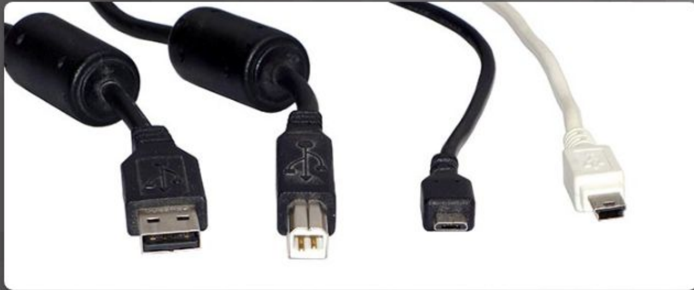
Разъем USB типа A