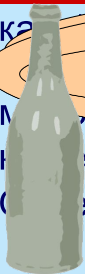
БУТЫЛКА МИНЕРАЛЬНАЯ ВОДА