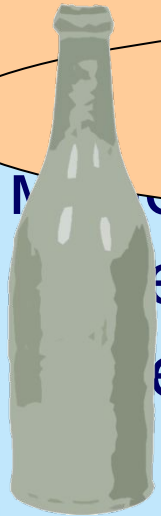
БУТЫЛКА МИНЕРАЛЬНАЯ ВОДА

СЮДА СТАКАН ПОСТАВИТЬ НЕЛЬЗЯ, ЗДЕСЬ ОН БУДЕТ СТОЯТЬ В СЕРЕДИНЕ СТОИТ СТАКАН. ЗНАЧИТ, В НЕМ – КОФЕ!