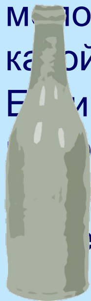
БУТЫЛКА МИНЕРАЛЬНАЯ ВОДА