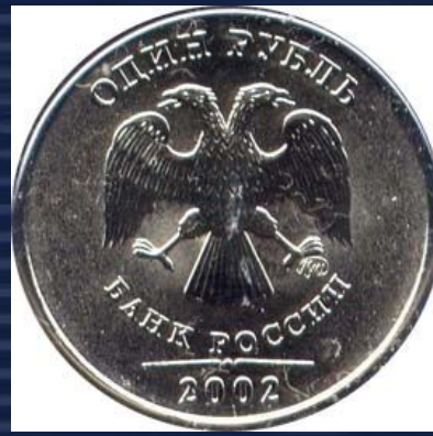
«орел» - обратная сторона монеты (реверс)