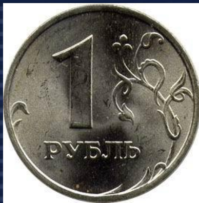
«решка» - лицевая сторона монеты (аверс)

Испытание – подбрасывание монеты; события – монета упала «орлом» или «решкой».