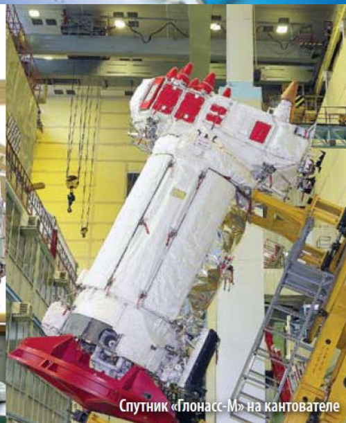
Спутник «Глонасс-М» на кантователе